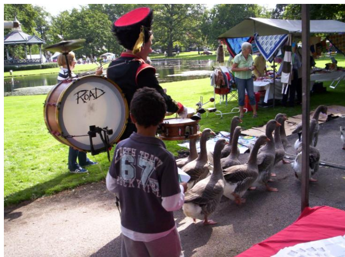
Ganzenparade waarmee mensen naar het Oranjepark werden gelokt

Stichting Peace Is The Way is aangesloten bij Stichting Mondial Apeldoorn. Bij deze stichting zijn allerlei Apeldoornse organisaties aangesloten die iets met ontwikkelingswerk doen.