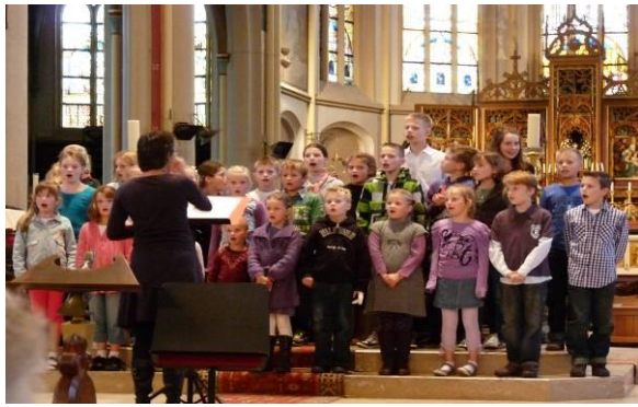
Kinderkoor op korenfestival op 25 september